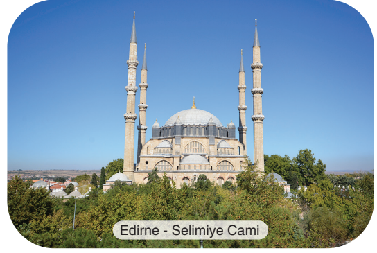
Edirne - Selimiye Camii

Selimiye'nin diğer cami mimarilerinden ayıran en büyük özelliği, herhangi bir yarım kubbeden destek almadan tek olarak inşa edilen kubbesidir. 8 sütun fil ayağına oturtulan kasnak üzerindeki kubbe, 43 metre yüksekliğinde ve 32 metre çapındadır. Bu özelliğiyle eser, mimari ve mühendislik üzerine araştırma yapanları şaşırtmaktadır. Kalem gibi ince, bir dantel gibi süslü, 3 şerefeli dört minaresi bulunan Selimiye'nin minarelerinin uzunluğu ise alemi dâhil 85 metre uzunluğundadır. Dönemin şartları düşünüldüğünde "inanılmazın başarıldığı" minareler 3 yollu olarak tasarlandığı için, minareden çıkan 3 kişi birbirini göremez. İznik çinileri ve revaklı avlusuyla da göz dolduran Selimiye'nin, müezzin mahfilinin mermer sütununa işlenmiş ters lale figürü için de halk arasında çeşitli rivayetler dillendiriliyor.